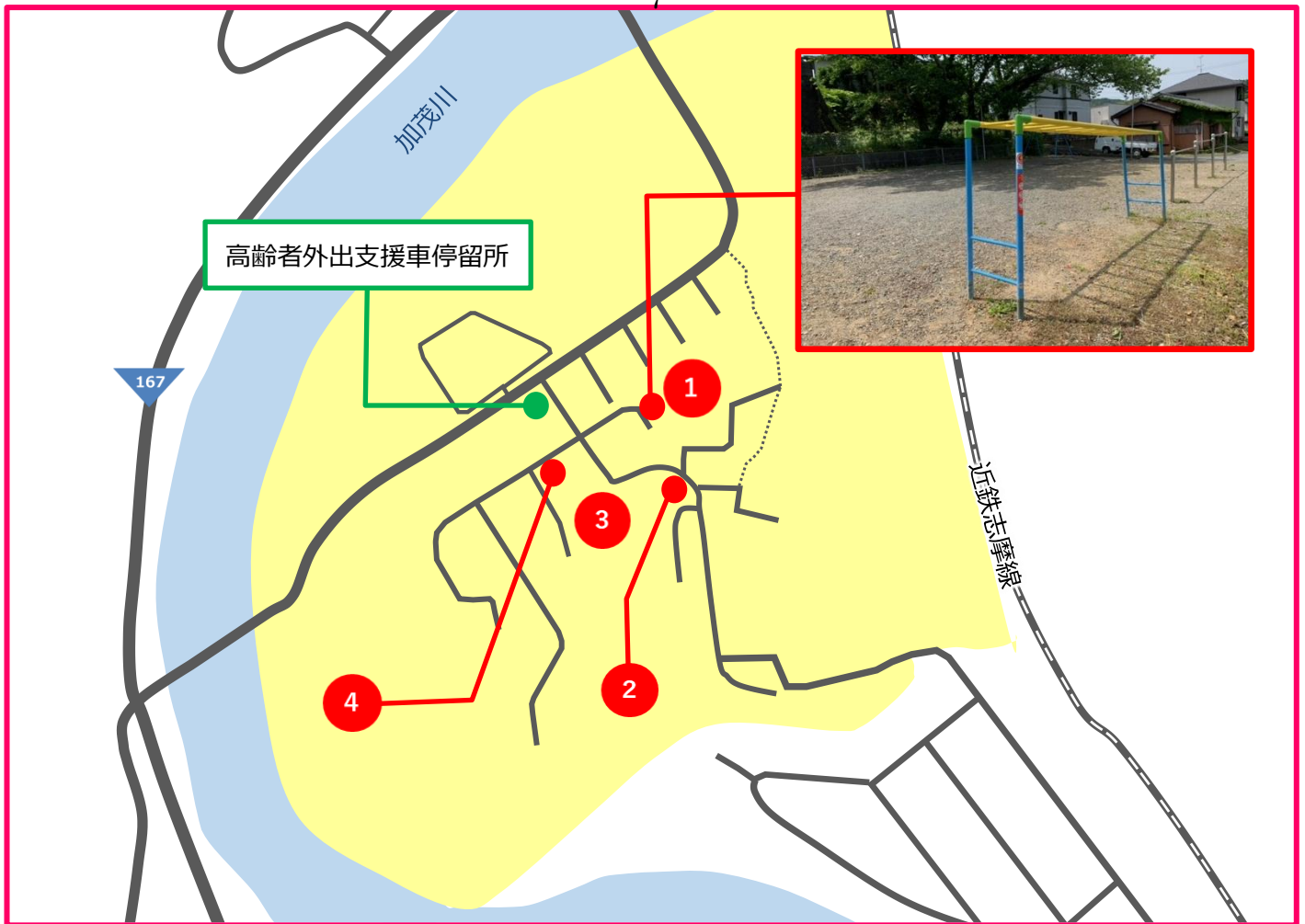
1 中央公民館 若杉分館