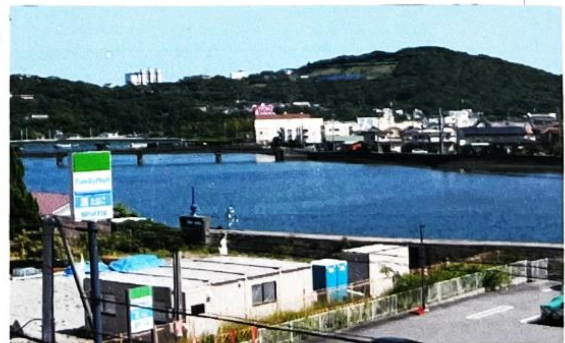
ハイツ赤崎からの眺望