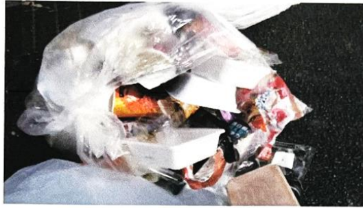
2023-8月 ゴミの分別のルール違反に 頭を悩ませています、