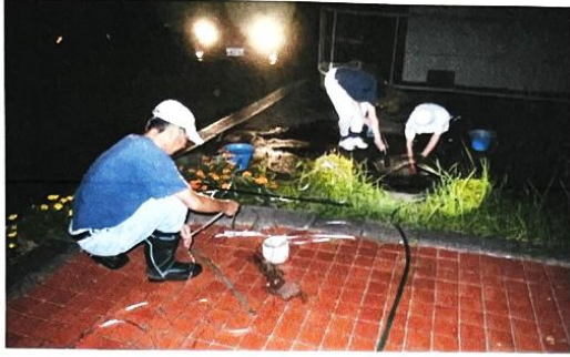
2023-7月 下水管が詰まり有志で 夜になる迄清掃作業をしました、 共同住宅の難点です