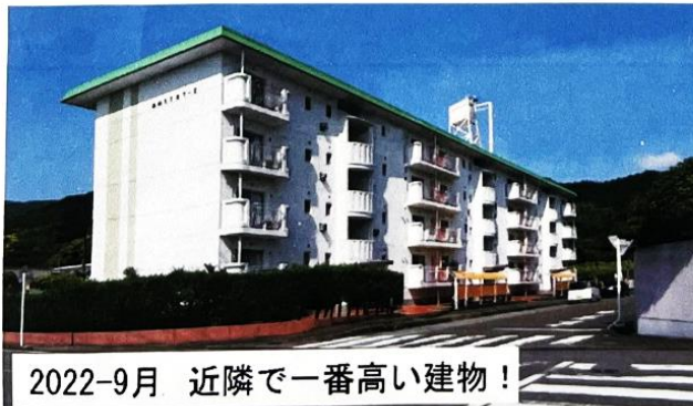
2022-9月 近隣で一番高い建物！ 県と市より津波の緊急避難場所 (垂直避難) 場所として検討中