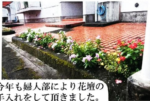
今年も婦人部により花壇の 手入れをして頂きました。