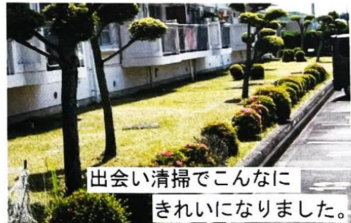
出会い清掃でこんなに きれいになりました。