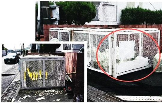
2023-8月 ゴミ集積場のカラスの被害防止 パネルを取付設置しました。