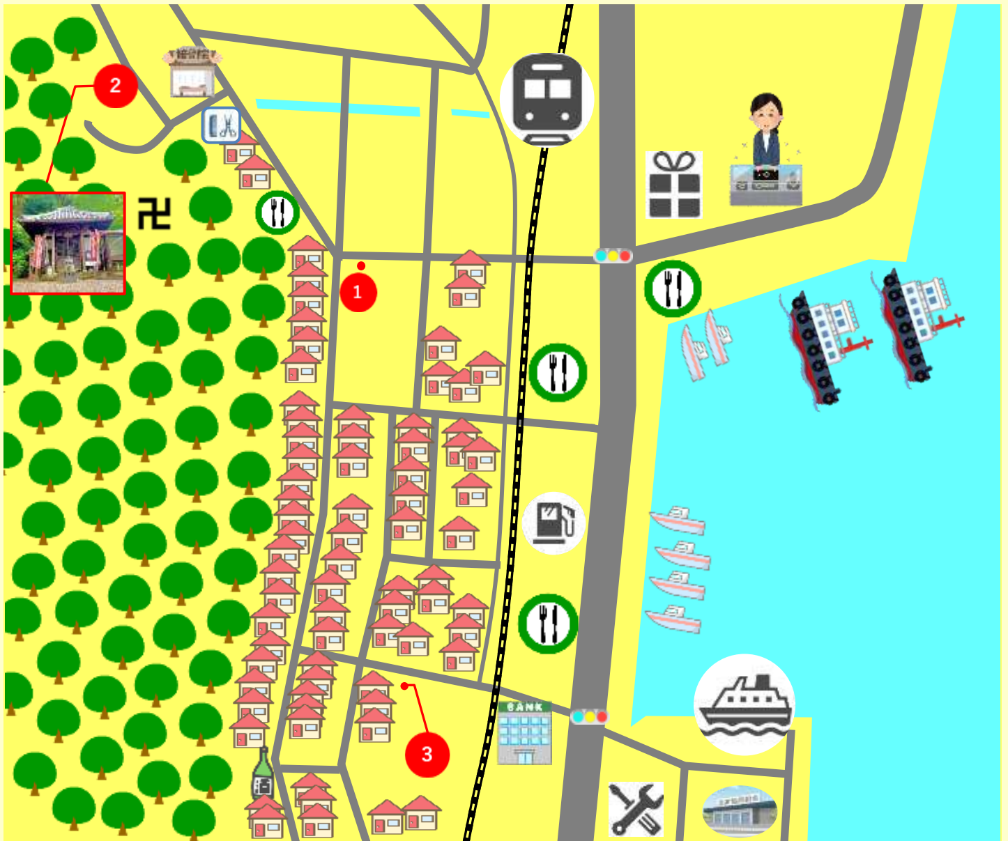
1 中之郷会館・移動販売場所