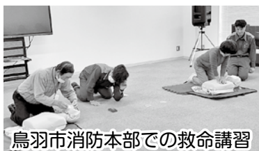
鳥羽市消防本部での救命講習