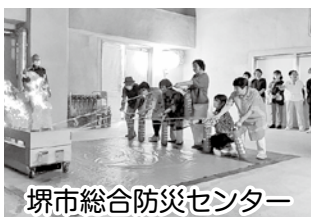
堺市総合防災センター

学習をはじめ、地震の恐ろしさを具体的に理解した上で災害時にとるべき行動の体験、消火体験、応急救護の講習など、多岐にわたる内容でした。これらのことから日頃の備えの大切さに気付き、災害が起きても適切な判断や行動がとれるようにしました。